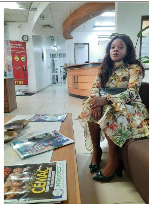
拜會喀麥隆最大的食品公司之一 Chococam