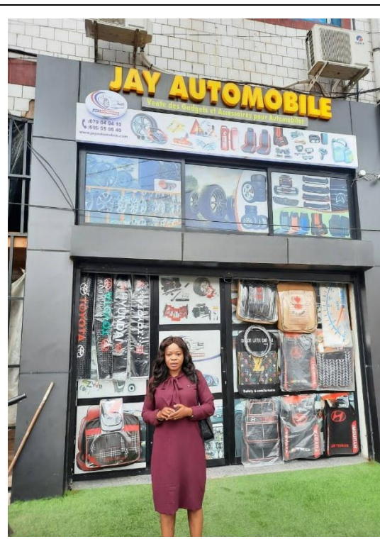
由法國進口的 Jay Automobile