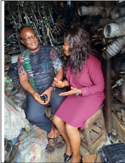
拜會買主 Autoparts Union