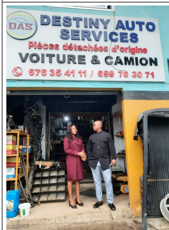
由杜拜與奈及利亞進口的進口商 Destiny Auto