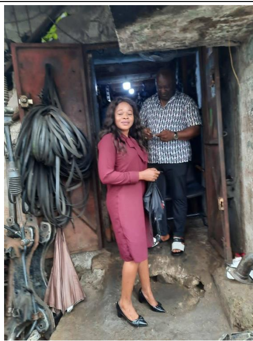
由歐盟國家進口汽車零件的 Branco Auto