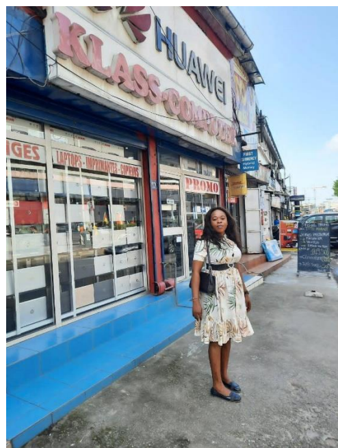
由中國大陸進口資訊設備的 Klass Computer