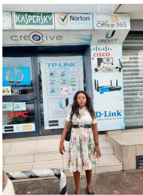
由法國進口的 Creative Computers 為當地頗大的資訊產 品進口商。