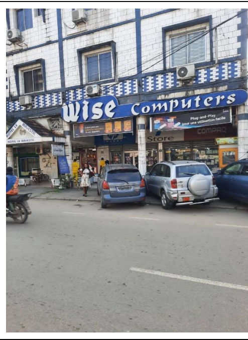
由法國進口資訊產品的 Wise Computers