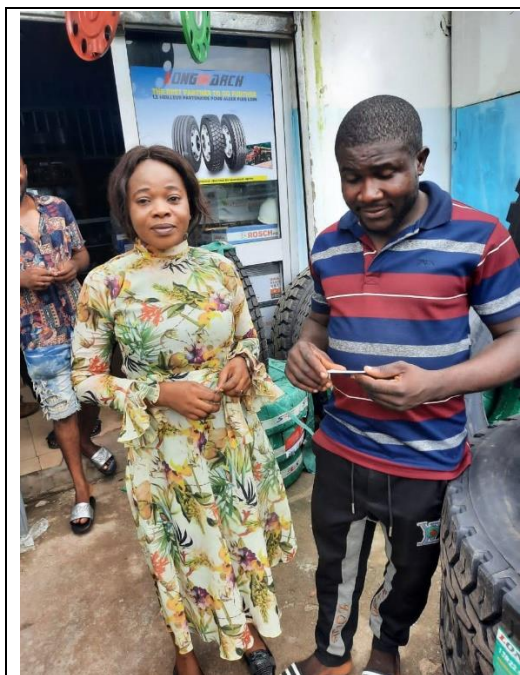
由中國大陸進口汽車零件的 Azhucam